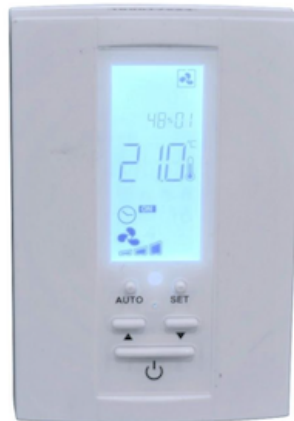
Pro-Remote Plus zender